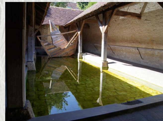
Savins : lavoir décoré

Le Montois, petit pays blotti entre le plateau de Brie et la vallée de la Seine, arrosé par Auxence, laisse admirer en chemin ses charmants villages et ses vastes points de vue.