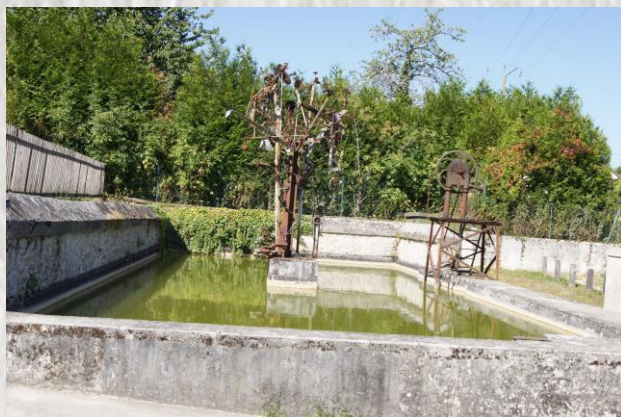
Savins : décoration d'un abreuvoir