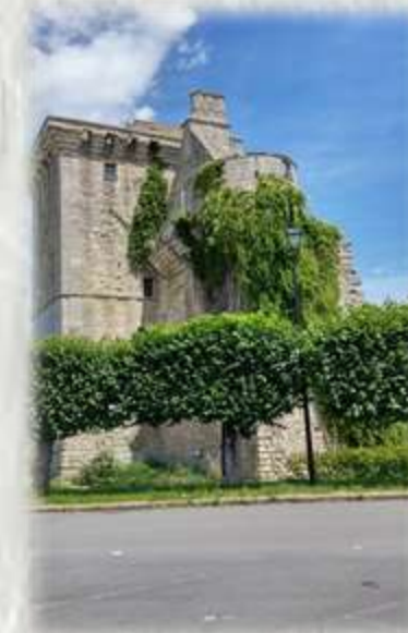
Crouy sur Ourcq-Donjon

Dépaysement garanti pour les adeptes d'une nature encore sauvage dans la traversée du bois de la Garenne et du marais du Négando.