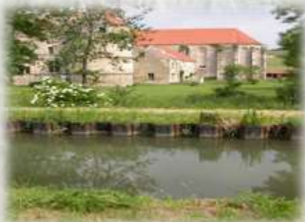
A Moisy, La Commanderie.