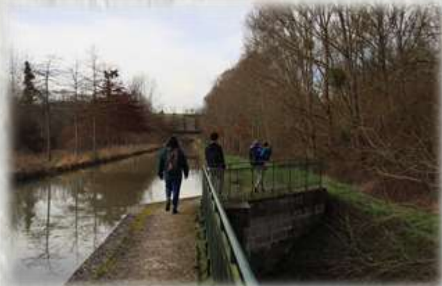
Pont canal du Clignon sur l'Ourcq

CODERANDO 77 Quartier Henri IV - Place d'Armes 77300 FONTAINEBLEAU 01 60 39 60 69 - www.randonnee-77.com -