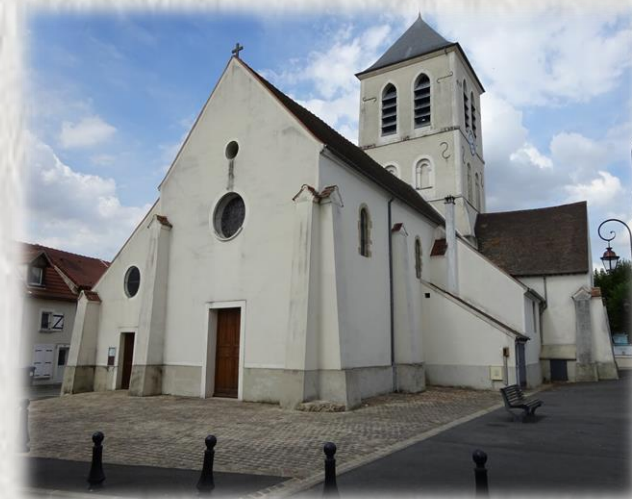
L'Église de Saâcy

Parcourez le sentier qu'empruntaient les ouvriers carriers au début du XX ème siècle, lorsque les coteaux abritaient encore des carrières d'extraction de pierre meulière mais aussi d'autres matériaux.