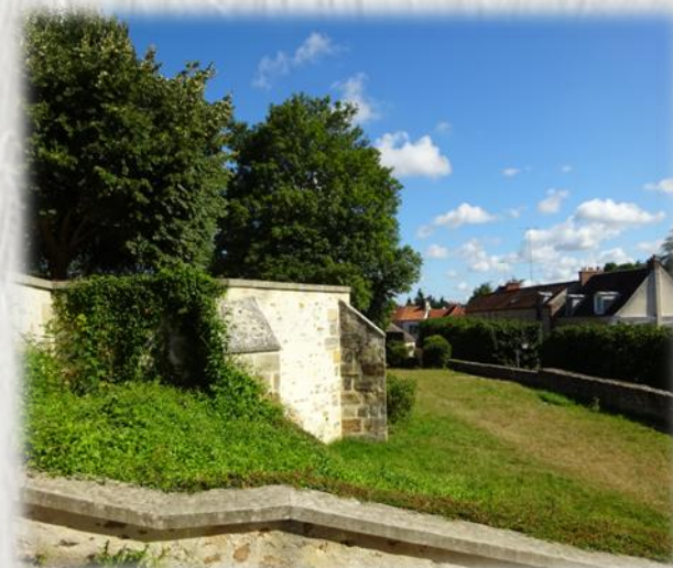
Tournan-en-Brie – les remparts

De gare en gare : Tournan-en-Brie / Mortcerf En forêt de Crécy