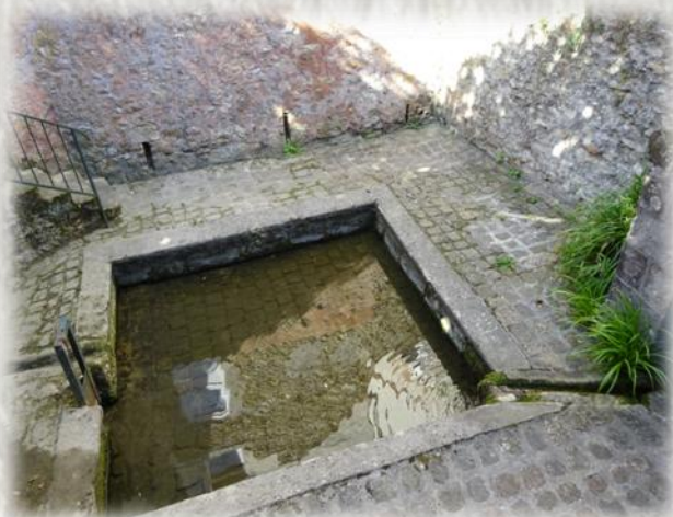
Tournan-en-Brie – Le lavoir des remparts