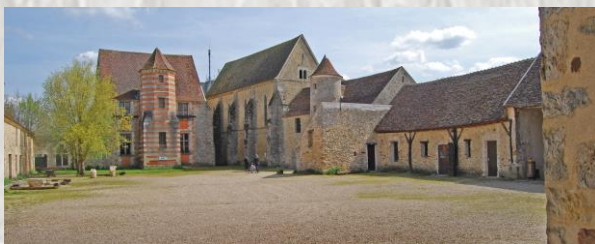
La commanderie de Coulommiers

Fondée en 1173, c'est l'exemple le plus complet au nord de la Loire de ce qu'était jadis une commanderie. Elle est d'abord une commanderie templière puis hospitalière. Vendue comme bien national à la Révolution à un fermier, elle reste la « ferme de l'Hospital » jusqu'en 1964, date à laquelle la municipalité décide de la racheter. Dès 1966, le site est restauré bénévolement par des passionnés. Depuis 1990, l'association ATAGRIF et la ville de Coulommiers perpétuent la protection et la mise en valeur du site, classé Monument Historique depuis 1994.