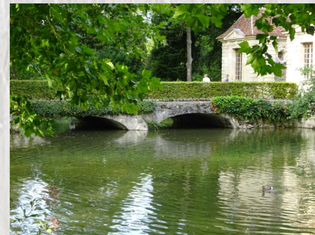
Parc des Capucins

Découvrez coulommiers, le pays du fromage et de l'imprimerie : une promenade qui vous conduira des rives du Grand-Morin à la commanderie des Templiers bordée par son jardin médiéval.