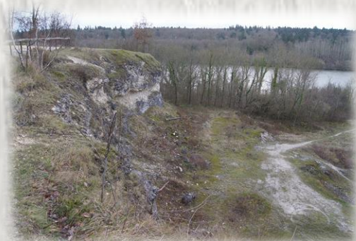
La Seine vue du site du four à chaud

Le gardien de la forêt : Point incontournable de vos escapades dans la forêt de Rougeau : le Gardien, un géant de terre et composite de presque 10 mètres de haut dont la tête est ornée de 5 cerfs de taille réelle! L'œuvre est née de la rencontre entre le site et l'artiste allemande Gloria Friedmann. « A travers le Gardien, je veux montrer que l'homme est toujours lié au monde animal » indique-t-elle. Ce qui l'a décidé à choisir Rougeau : son histoire, son patrimoine naturel et notamment ses chênes majestueux.