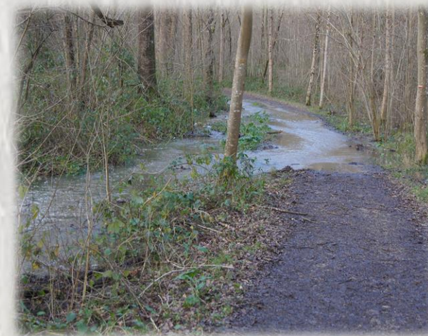
Le ravin du Gouffre (en crue) sur le GR

C'est une forêt typique d'Île de France, dominant la vallée de la Seine et marquée par l'Histoire : pavillon royal et château, grandes allées pour les chasses royales et arbres vénérables.