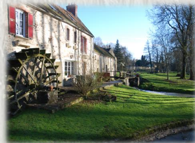
Moulin de la Vallée à Dormelles

A partir du pittoresque village de Villecerf, parcourez les hauteurs nord et sud de la vallée de l'Orvanne et découvrez au passage les vestiges d'un grand château et un haut lieu de Résistance de la Seconde Guerre mondiale.