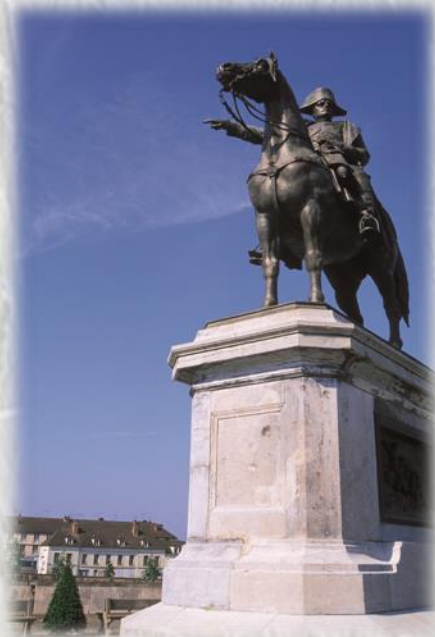
Statue de Napoléon 1er à Montereau

CODERANDO 77 Quartier Henri IV - Place d'Armes 77300 FONTAINEBLEAU 01 60 39 60 69 – www.randonnee-77.com -