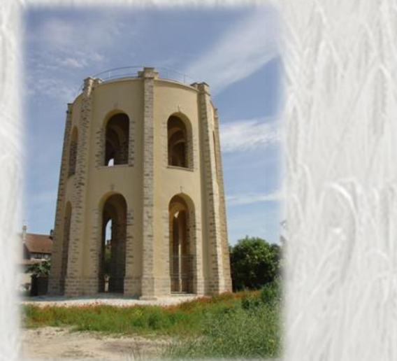
Forges : base de l'ancien château d'eau

Un tour sur le plateau briard, entre champs et bois, puis un détour vers la confluence Seine/Yonne nous donnent une idée du site où les troupes de Napoléon 1er ont combattu pour une des dernières fois..