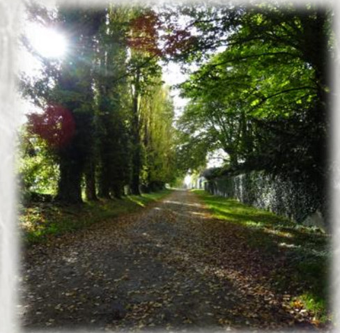
Jouarre : allée à Venteuil

Après l'étang et le château de Péreuse, parcourez l'agréable terre-plein herbeux de l'aqueduc de la Dhuis qui serpente sur les coteaux de la rive gauche de la Marne. Profitez de nombreux points de vue sur les villages, puis sur le confluent de la Marne et du Petit-Morin.