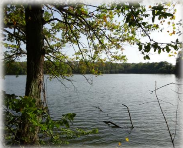
Étang de Péreuse

Le héron cendré est une espèce protégée, majestueuse qui vit en colonie dans des nids au sommet des arbres. Échassiers de couleur grise, son torse est blanc et sa tête s'orne d'une crête noire. Il fréquente toutes les zones aquatiques, pourvu qu'elles soient poissonneuses, car le héron se nourrit essentiellement de poissons et de batraciens. Il peut adopter des positions statiques en se tenant sur une patte, le cou rentré dans les épaules. Sa manière de chasser est très caractéristique : il longe silencieusement les berges en marchant et assènera un coup de bec dans l'eau dès qu'il verra une proie potentielle. En vol, il étend ses longues ailes en planant. Il se rencontre beaucoup sur les berges de la Marne, dans les étangs et les marais.