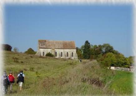
Longueville : église de Lourps