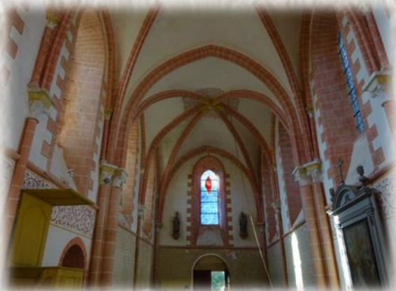
Longueville : église de Lourps vu de l'intérieur

Au sud-ouest de Provins, Lourps voit son église isolée sur la colline, hors du village. Colline baptisée encore « montagne » dans les guides touristiques d'il y a quelques décennies... Étroite et modeste, l'église présente un porche s'ouvrant sur le paysage. Sur la rive droite de la Voulzie, le village évoque le séjour de l'écrivain Huysmans en 1885-1886. Il s'en inspira pour ses romans A rebours et En rade , écrivant sur ce village de Lourps et son église du XIII ème , éclairées la nuit tel un phare. Le romantisme des lieux devint un véritable décor pour Huysmans. L'église avec un portail sculpté gothique, des fresques murales intérieures et de nombreuses pierres tombales entre dans cette atmosphère unique où vécurent les héros de l'écrivain. Un rendez-vous solitaire pour randonneurs en quête de rêveries.