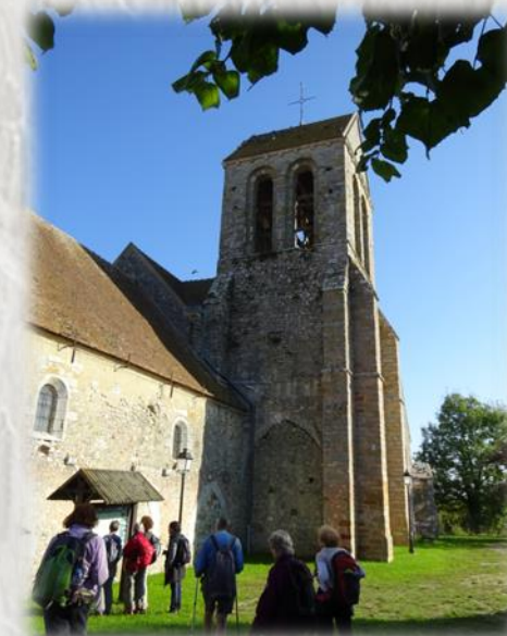
Église de Savins

Entouré par son vieux cimetière, la modeste église de Lourps, isolée sur une colline, évoque les œuvres de J.-K. Huysmans. De là, le panorama s'étend de la région de Provins jusqu'aux vallées de la Seine et de la Voulzie.