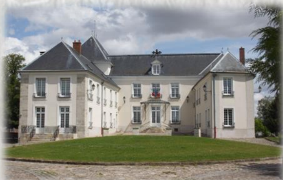
Verneuil L'Étang : Mairie