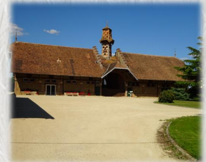
La Ferme de Forest

Ce circuit vous invite à découvrir une des nombreuses fermes qui jalonnent le plateau briard : la ferme de Forest. Enclose de toutes parts, ses toits pentus encadrent un porche colombier très curieux.