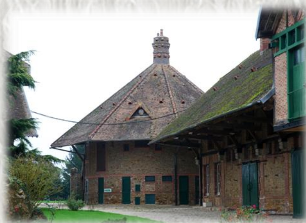
La Ferme de Forest

CODERANDO 77 Quartier Henri IV - Place d'Armes 77300 FONTAINEBLEAU 01 60 39 60 69 – www.randonnee-77.com -