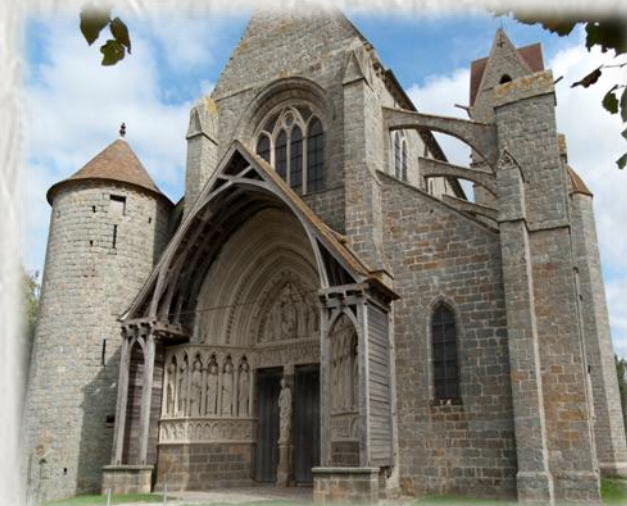
Église Saint-Éliphe à Rampillon

Circuit où vous pourrez admirer le portail de l'église Saint-Éliphe de Rampillon, terre des Hospitaliers de Saint-Jean de Jérusalem, ainsi que Vanvillé, dépendance de la commanderie.