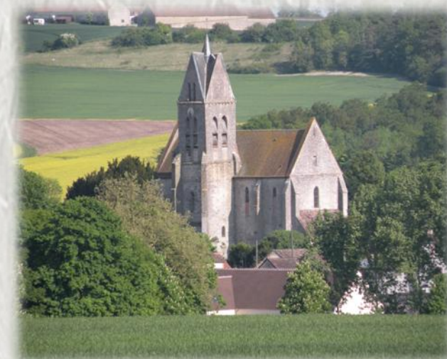
L'église de Salins

Salins, anciennement appelé Villeneuve-la-Cornue du nom de son seigneur Symon le Cornu, eut son apogée grâce à l'industrie céramique, comme en témoigne encore le nom de certains lieux-dits traversés.