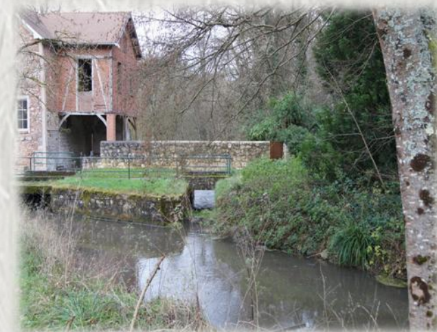
L'École au moulin de Montgermon

En suivant l'École jusqu'à la Seine où la rivière termine sa course, les lavoirs rappellent l'époque des bavardages, quand les bavardages résonnaient dans la vallée.