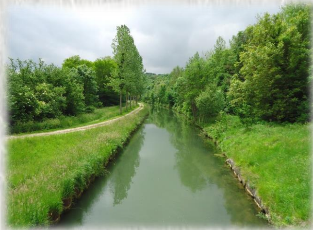
Photo : Canal de l'Ourcq au pont de May-en-Multien © OT du Pays de l'Ourcq.