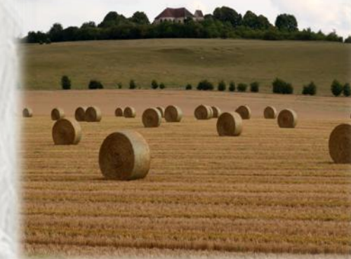
La Butte de Doue

De gare en gare : La Ferté-sous-Jouarre / Coulommiers « A l'assaut de la butte de Doue »