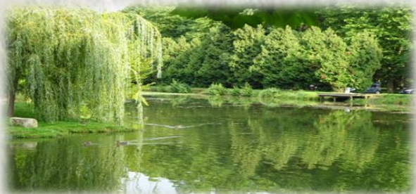
Parc des Capucins

Le parc des Capucins est le plus célèbre jardin public de la ville de Coulommiers, en Seine-et-Marne. Parc fleuri parmi les plus beaux d'Île-de-France. Le château fort joua un rôle important au cours de la Guerre de Cent Ans et des guerres de religion. Le château fut reconstruit au XVII e siècle par Catherine de Gonzague, duchesse de Longueville, et détruit quelques décennies plus tard par le duc de Luynes. Seuls demeurent les pavillons des gardes et une partie de l'aile du château. La chapelle des Capucins, située à l'intérieur de l'église Notre-Dame-des-Anges et construite en même temps que le château, abrite le musée municipal. Celui-ci accueille des expositions de collections historiques, archéologiques et des œuvres d'art. Le parc des Capucins abrite les vestiges du château de Catherine de Gonzagues, ainsi que des plans d'eau autour des anciennes douves et quelques essences rares. Il fut sévèrement touché durant les tempêtes de 1999.