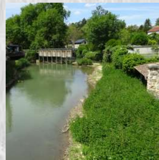
La Ferté-Gaucher : Le Grand-Morin

Ce circuit, passant par le lieu-dit des Ramonnets et le hameau de Montigny, vous fera découvrir un double panorama sur le méandre du Grand-Morin entre la Ferté-Gaucher et Jouy-sur-Morin.