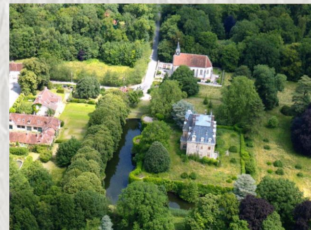
Crèvecœur-en-Brie : village / église