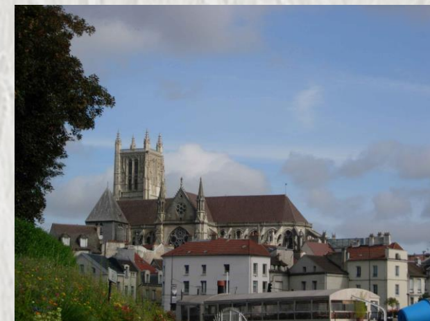
Meaux : Photo CD ©

Cette randonnée vous fera découvrir le vieux Meaux, avec ses joyaux : la cathédrale St-Etienne, le Palais épiscopal, le jardin de l'archevêché et le musée Bossuet. Le parcours est ensuite très bucolique avec le canal de l'Ourcq et les espaces naturels du Brasset. Après la visite du Musée, retour par les hauteurs où vous pourrez profiter de beaux points de vue sur Meaux et sa cathédrale."