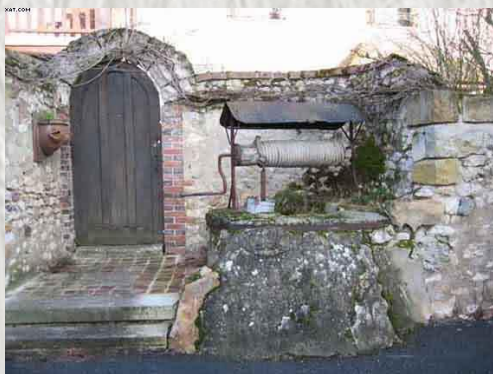
Puit à Thénisy

Le Château de Sigy : il fut édifié au cours de la guerre de 100 ans, remanié au XVII ème siècle. Il est construit sur pilotis et entourées de douves larges de plus de 35 mètres à certains endroits.