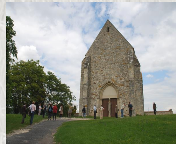
L'Église de Paroy

Cette belle randonnée vous permettra d'admirer plusieurs points de vue à la limite de la Bassée et du Montois, ainsi que la surprenante église de Paroy.