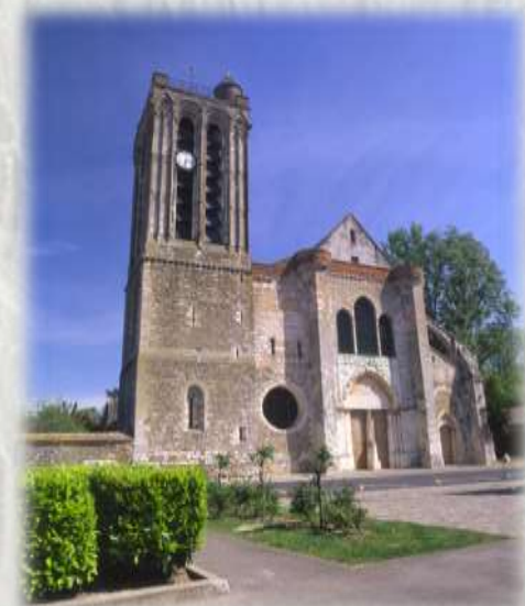
Collégiale Saint Martin de Champeaux – Photo : SMT ©

Le val d'Ancoeur est riche en édifices historiques, les plus réputés étant le château de Vaux-le-Vicomte et la collégiale de Champeaux. Ce circuit permet de voir le château fort de Blandy-les-Tours, le château de Bombon et Champeaux.