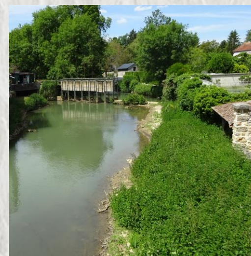
La Ferté Gaucher – Photo CD ®

C'est un parcours le long du Grand-Morin et de ses coteaux sud que vous propose ce circuit. Pas de monotonie car vallons, bosquets et plateau alternent avec, au passage une vue sur les anciennes papeteries de Crèvecoeur et le château de Chauffour.