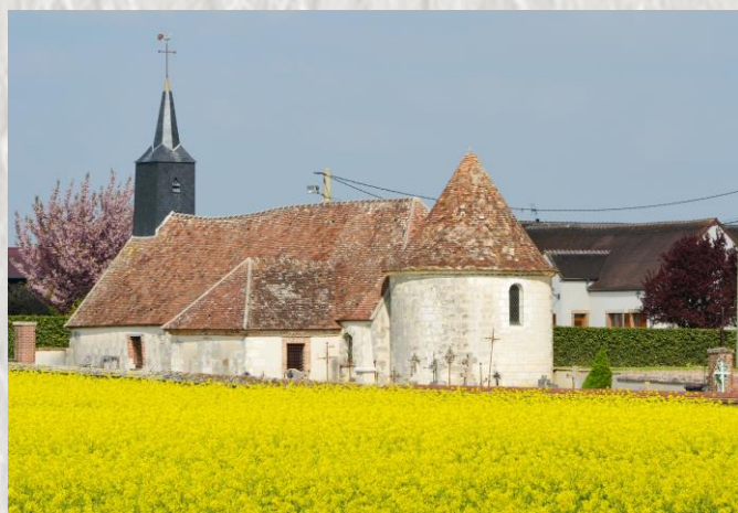
Baby église mausolé

Encore un site méconnu de Seine-et-Marne et pourtant que de découvertes au long de ce parcours : les églises de Villenauxe et de Villuis et, le site de Queue Chat dominant la plaine et habité depuis la Préhistoire.