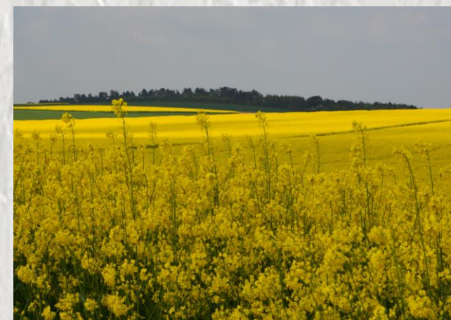
La butte Queue-Chat