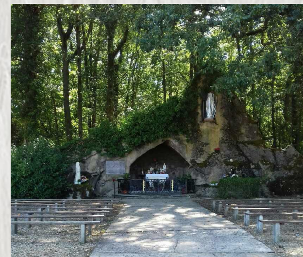
Grotte Notre Dame de Lourdes à Amillis

Le champ Blanchar, Bellevue, la passerelle de Pisseloup... que de noms évocateurs ! Une réplique de la grotte de Lourdes, une ancienne commanderie, quelques vieilles maisons au cœur du village.