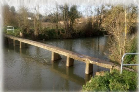
L'Yerres- ancien pont d'une seule dalle (perret) doublant un gué

L'Yerres est une petite rivière imprévisible et fréquemment en crue. Tantôt large lors de ces débordements, tantôt étroite, elle se franchit à Soignolles-en-brie par trois gués, praticables en dehors des périodes de crue, et un grand pont. Les gués sont bien connus des randonneurs. L'indication de leur emplacement était précieuse pour la marche. Ils étaient déjà répertoriés au XII ème siècle dans le Codex Calixtinus pour les pèlerins de Compostelle. Les ponts étaient plutôt rares, les gués restaient le moyen le plus facile pour traverser les rivières. Encore fallait-il les connaître et qu'ils soient soigneusement entretenus. Autres témoins de cette histoire d'eau : les lavoirs et les moulins souvent tout proches.