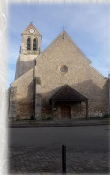
Église de Soignolles

L'Yerres est certainement l'une des rares rivières de France à se traverser encore à gué. Une expérience surprenante à réaliser. Préférez-vous le pont ou marcher - légèrement - dans l'eau ?