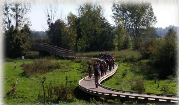
Soignolles : nouvelle passerelle sur l'Yerres – Photo : C.P ©