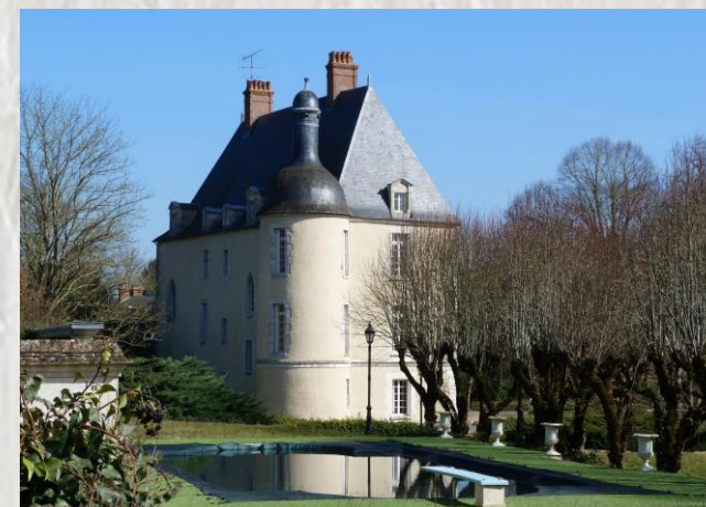
Château de Fay-les-Nemours

Découvrez ce vallon tranquille habité dès la Préhistoire, il ménage des points de vue sur la campagne environnante. Le charmant village de Fay-les-Nemours se niche sur ces pentes boisées.