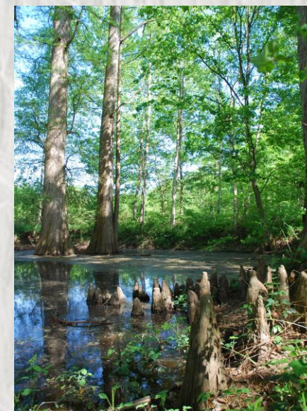
Forêt de Barbeau : Mare avec cyprès chauve

Le parcours en forêt domaniale de Barbeau s'effectue entre des vallons et un balcon sur la Seine, pour observer la flore des sous-bois et des champs.