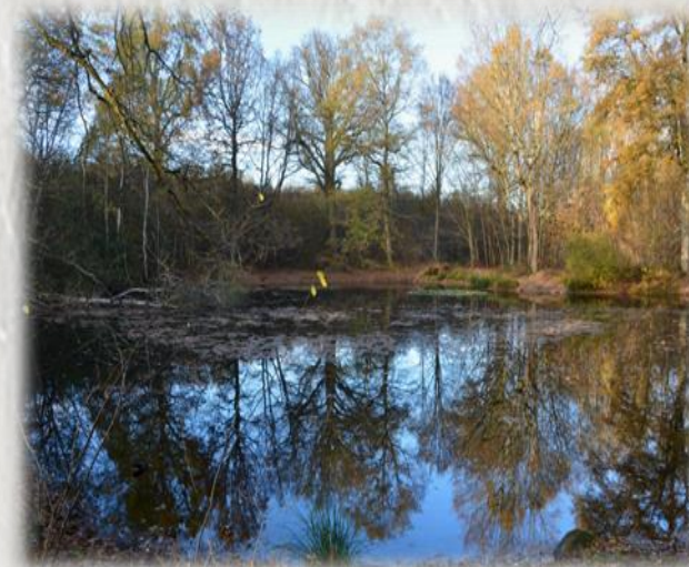
La Mare Périlleuse – Héricy

Sans doute l'écrivain Stéphane Mallarmé avait-il déjà apprécié cette balade vers la mare Périlleuse, proche de son domaine... « Tout est joli, de mille verts et parfumé », admirait-il au printemps 1896.