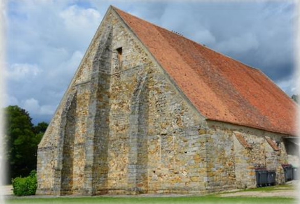
La grande aux Dimes à Samoreau

Le musée départemental Stéphane Mallarmé fait face à la Seine et à la forêt de Fontainebleau. Au travers des objets de son quotidien, de ses œuvres et de celles de ses amis peintres et sculpteurs, le musée restitue l'intimité et l'univers du poète. C'est en 1874 que Stéphane Mallarmé découvre au lieu-dit Valvins, cette ancienne auberge pour les cochers d'eau. Pendant vingt ans, il y loue deux pièces pour de courts séjours en famille, principalement à la Toussaint, à Pâques et en été. Ce n'est qu'à sa retraite qu'il loue quatre pièces supplémentaires pour des séjours en solitaire plus longs. Ces moments à Valvins sont pour lui une nécessité et un vrai ressourcement. Le canotage sur la Seine et le jardinage sont les grands plaisirs de Mallarmé. Il y meurt le 9 septembre 1898 et est enterré avec sa famille au cimetière de Samoreau. Achetée en 1902 par Geneviève Mallarmé, la fille du poète, la maison est inscrite à l'inventaire des monuments historiques en 1946 et reste la propriété des héritiers jusqu'en 1985. Elle est alors acquise, avec son mobilier et sa bibliothèque, par le Conseil Départemental de Seine-et-Marne. Le musée ouvre au public en 1992.