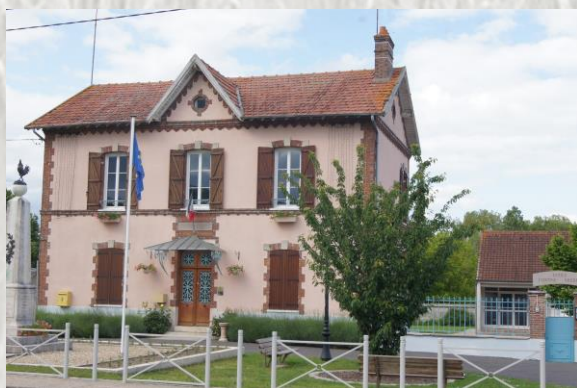
Mairie école de Nonville

La voute de la nef de l'église Saint-Michel est en berceau et remonte au XII ème siècle. Le clocher carré à quatre pans est refait au XVII ème siècle. Saint-Michel chef de la milice céleste, est une dédicace très rare dans la région. Un retable est dédié à Saint Loup qui était réputé guérir les fièvres des enfants et protéger du loup. En 1835, une carrière de pierre blanches, très compactes a été ouverte sur le territoire de la commune. Lorsque cette pierre est polie, sa teinte jaune, mêlée de veines claires, lui donne de la ressemblance avec certains marbres isabelle.