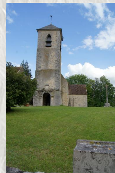
L'église de Nonville

Cette randonnée centrée autour du village de Nonville (anciennement « Anonvilla »), vous fera découvrir ce site du bocage Gâtinais à travers les bois et les champs et le long du vallon du Lunain.