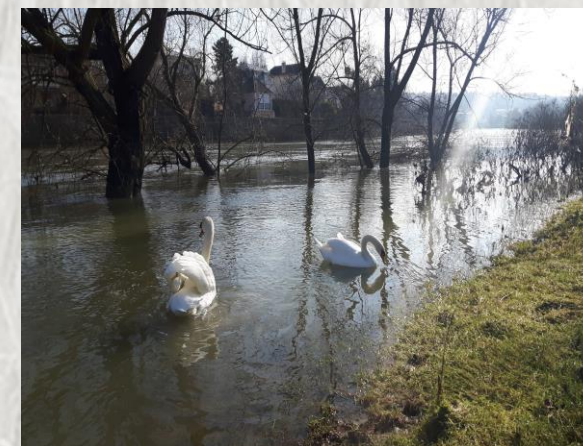
Thorigny / Lagny

Variée et ombragée, cette balade paisible qui serpente sur les coteaux de la vallée de la Marne et sur l'aqueduc de la Dhuis vous fera découvrir villages et panoramas.