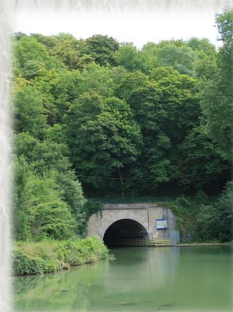
Tunnel de Chalifert

En suivant la vallée de la Marne, ce sont d'étranges sculptures, la maison natale de Louis Braille et l'impressionnant viaduc du TGV que nous découvrirons.