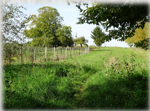
Terre-plein sur l'aqueduc de la Dhuis