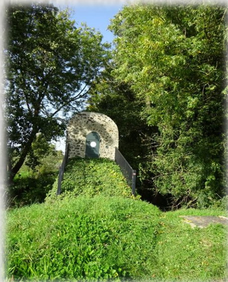
Regard au-dessus d'un siphon

La Dhuis, aqueduc souterrain qui relie Château-Thierry au réservoir de Ménilmontant sur 131 km, alimentait Paris en eau potable. Construit en 1863 et 1865 sous Napoléon III, l'aqueduc capte l'eau de la rivière la Dhuis, qui prend sa source à Pargny-la-Dhuys. Il franchit les vallées et les rivières grâce à des ouvrages en pierre meulière. Le trajet de l'aqueduc de la Dhuis est jalonné périodiquement d'édicules hémisphériques en pierres révélant son parcours lorsqu'il est souterrain. Ce sont des regards d'accès à la canalisation pour son entretien. Sur chacun d'entre eux figurent un petit cercle métallique qui donne l'altitude du lieu par rapport au niveau de la mer. La circulation de l'eau se fait par pente naturelle et utilise l'effet « siphon » avec un débit de 230 litres d'eau par seconde.