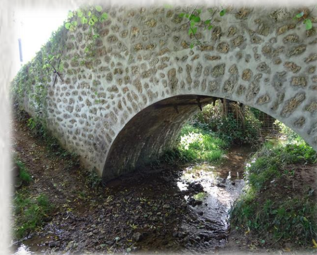
Ru passant sous l'aqueduc de la Dhuis

Après les anciennes carrières aujourd'hui boisées, le terre-plein herbeux de l'aqueduc de la Dhuis vous emmènera dans le minuscule hameau des Poupelins, puis vous reviendrez par les bords de la Marne