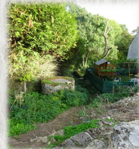
Vauharlin – Photo C.D ©

Luzancy, réputé pour les peintres qui y séjournèrent, était aussi célèbre pour ses bords de Marne et ses quinguettes.