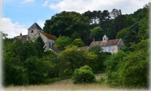
Église de Saint-Aulde