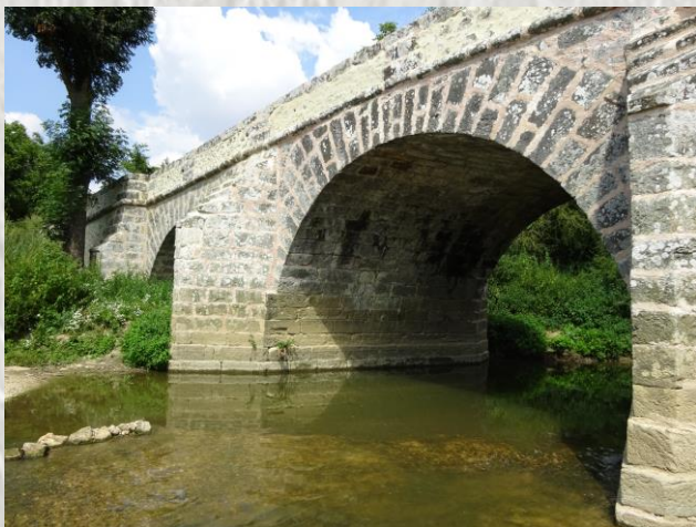
Grégy-sur-Yerres : Le pont des Romains

À Grisy-Suisnes, le musée de la Rose vous propose une halte pour découvrir l'incroyable épopée de ces fleurs et des hommes qui les cultivaient. Dans l'ancienne gare de Grisy, entièrement réaménagée, le musée de la Rose (ouvert uniquement le dimanche de 14h à 18h) fait revivre l'histoire des deux cent cinquante rosiéristes qui ont contribué à faire de la région le « Pays des roses ».