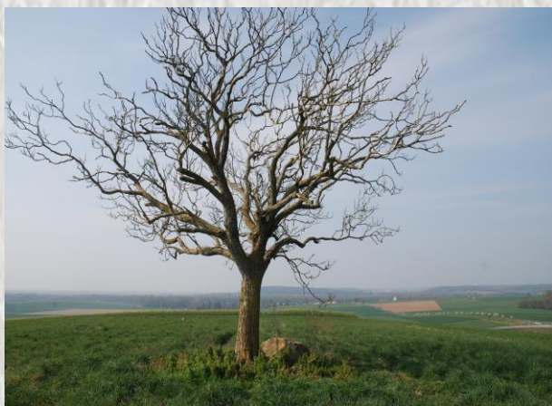
Paroy : L'arbre de la justice

Tout au long de son cours plutôt vif et souvent au milieu des bois, la Voulzie a fait tourner les moulins et fonctionner des usines ; pour elle et ses affluents on compta jusqu'à 35 moulins ; il en reste une douzaine aujourd'hui. Mais l'originalité de cette rivière tient au fait que ses sources, ainsi que celles de deux de ses affluents, le Durteint et le Dragon, ont été captés pour alimenter Paris. Alors pour qu'à Provins il reste de l'eau dans la rivière, une station de pompage fut réalisée à Saint-Sauveur les Bray, afin de renvoyer de l'eau de Seine jusqu'au niveau des sources. Ainsi pour que la Voulzie coule au robinet des parisiens aura-t-il fallu que la Seine coule à Provins !