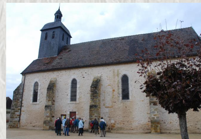
L'Église des Ormes sur Voulzie

Du sommet du tertre de l'église de Paroy, découvrez les collines du Montois et le vallon de l'Auxence. Plus loin, vous visiterez le Provenois et les moulins de la vallée de la Voulzie.