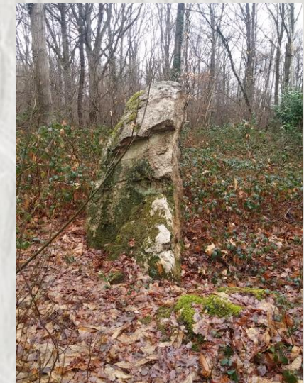
Le Menhir du Grand Berger

Ce parcours vous mènera tranquillement du bord de Seine au plateau à l'ouest de Melun, au travers une zone boisée. C'est une relique de l'arc forestier du IX e s. au sud et à l'est de Paris, englobant les bois de Livry, Bondy, Vincennes, Sénart et Rougeaux.