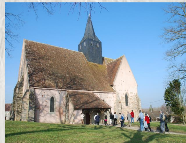
L'Église Saint-Aignan

L'Orvin, ruisseau affluent de la Seine sera notre fil conducteur pour cette randonnée aux confins de la Seine-et-Marne et de l'Aube. Nous découvrirons au passage plusieurs lavoirs aux formes variées et la belle église de Fontaine-Fourches.