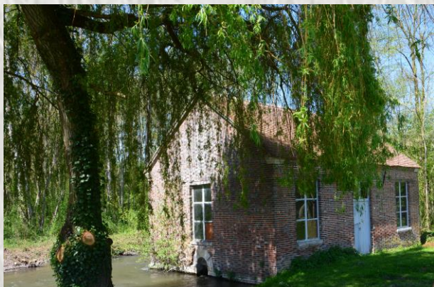
Cercy : Lavoir

Les Lavoirs : on en compte quatre sur la commune, fonctionnant à l'identique : alimentés par des sources, ils sont construits sur le même plan.