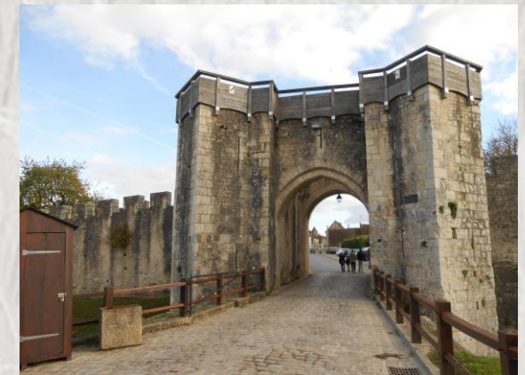
Provins : porte de Jouy coté extérieur

Une randonnée sur un itinéraire transposé au moyen-âge ; Voici ce qu'offre ce circuit au travers la ville de Provins qui vous fera côtoyer remparts spectaculaires, donjon, vieilles bâtisses, édifices anciens, en empruntant parfois des voies étroites, et des escaliers qui affirment bien le terme de "ville haute".