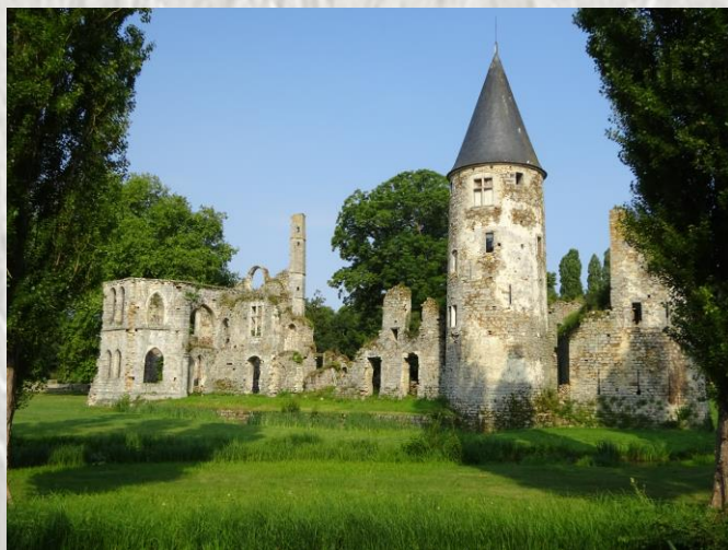
Le Château du Vivier