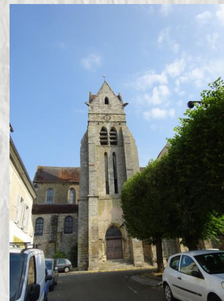
L'Église de Chaumes-en-Brie

Le Vivier, avec ses étangs et les ruines de son château, la vallée de l'Yerres dominée par le viaduc de l'ancienne voie de chemin de fer et, enfin, Chaumes-en-Brie, vous attendent sur ce circuit typiquement briard.