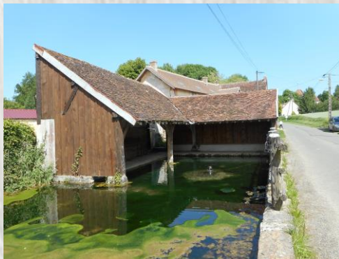
Lavoir à vieux-Maison