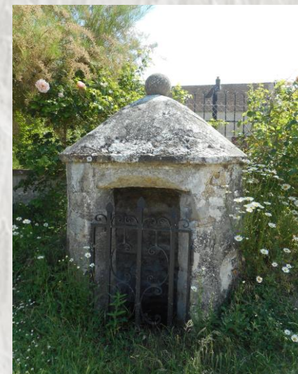
Fontaine à Vieux-Maison

Architecture, histoire, faune et flore sont les ingrédients de cette randonnée pittoresque. Découvrez le village des amoureux et l'histoire du diamant de Sancy au détour des chemins en sous-bois ou dans la plaine de Brie.