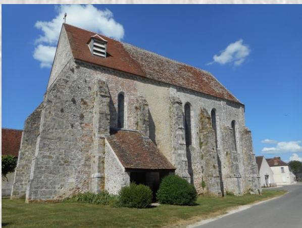
L'Église de Cerneux

Le diamant de Sancy : Sancy les Provins est l'ancienne seigneurie de Nicolas Harlay de Sancy (1546-1629), acquéreur du diamant de Sancy, d'une taille de 52 carats. Au service du roi Henri III en 1589, il s'offre une armée de mercenaires suisses, grâce à la vente du fameux diamant aux anglais. Il mène campagne en Savoie pour le roi, qui n'a rien déboursé. C'est ainsi qu'il conquiert le pays de Gex en Suisse, il sera rattaché à la France en 1601.