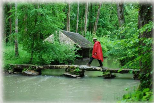
Le Pont Thierry