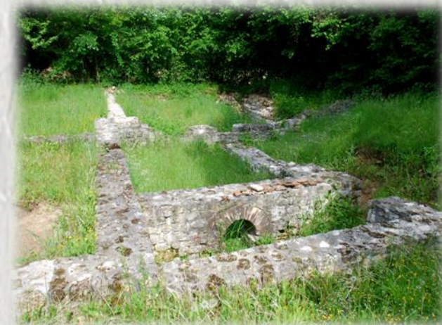
Paley : La cave aux fée

Depuis le petit bourg de Remauville, parcourez le plateau agricole avant de découvrir la charmante vallée du Lunain que jalonnent ponts, lavoirs et moulins. À Paley, vous trouverez des vestiges historiques de l'époque mérovingienne à la Révolution.