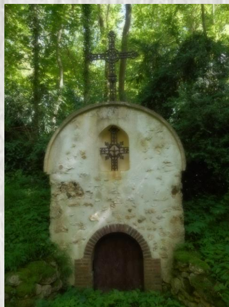
Fontaine Saint Edme

CODERANDO 77 Quartier Henri IV - Place d'Armes 77300 FONTAINEBLEAU 01 60 39 60 69 – www.randonnee-77.com -