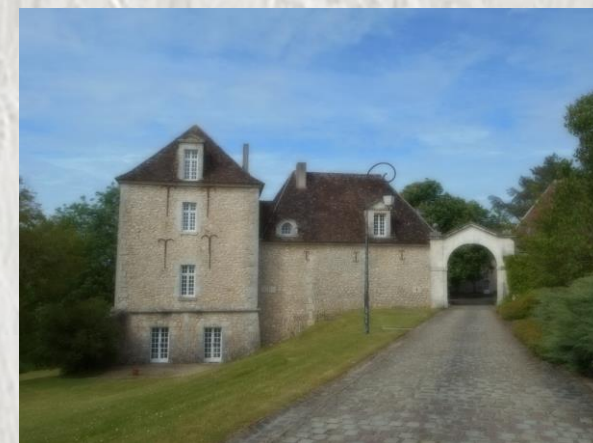
Le Château de Montramé

Cette randonnée aux paysages variés permet de découvrir différents patrimoines relatant l'histoire de Soisy-Bouy. Le parcours alterne entre bois et cultures, plateaux et vallons avec de belles vues sur la vallée de la Seine et des villages environnants. La découverte de lavoir, fontaine, église, château, vestiges... agrémenteront le parcours.