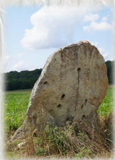
La roche aux aiguilles

On raconte qu'autrefois, les jeunes filles venaient jeter des épingles dans les trous de la roche en s'arrangeant pour qu'elles ne tombent pas, signe de mariage dans l'année. Coutume païenne qui se retrouve dans de nombreuses forêts ou étangs de France.