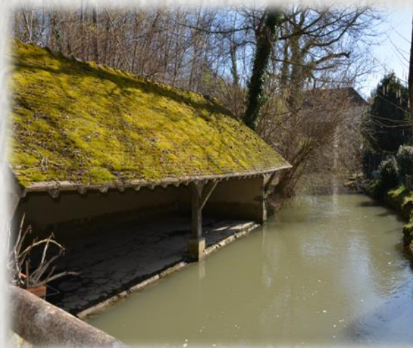
Le Lunain à Nanteau

Aux portes de Fontainebleau, entrez dans le tunnel de verdure de la forêt de Nanteau, à la découverte de pierres granitiques singulières, sujets de légendes et de coutume celtiques.