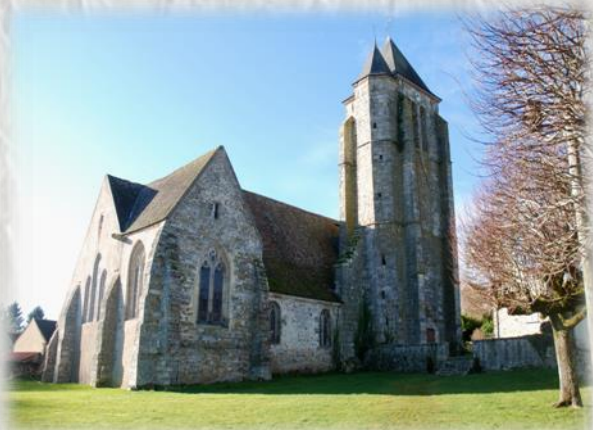
Église de Dormelles

Sucre d'Orge de Moret, miel et pain d'épices du Gâtinais, chasselas de Thomery, spécialités fromagères et maraîchères...En Seine et Loing, on ne manque pas d'arguments pour séduire les gourmands. Si la nature généreuse du terroir fait partie intégrante de l'identité de ce territoire, elle se conjugue au savoir-faire des nombreux petits producteurs qui maintiennent et font vivre l'amour de la bonne chère. À Dormelles, Nanteau-sur-Lunain, et Ville-Saint-Jacques, des fermes et des producteurs artisanaux ouvrent régulièrement leurs portes et proposent dégustation sur place, vente ou cueillette de leurs produits. Leur hospitalité et leurs passions sont contagieuses !