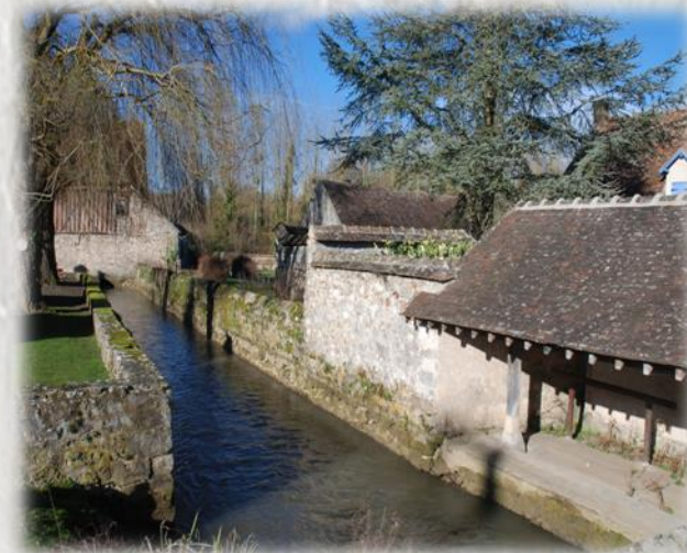
Lavoir à Flagy

Des lavoirs, des moulins, les eaux claires de l'Orvanne, rivière de première catégorie, des villages où les églises suscitent la visite, autant d'attraits pour le randonneur dans ce coin du Gâtinais.