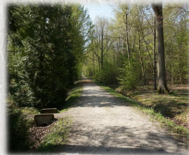
Forêt de Villefermoy

Entre châteaux, églises, lavoirs et fermes, ce circuit vous emmène en forêt de Villefermoy, massif classé Natura 2000.