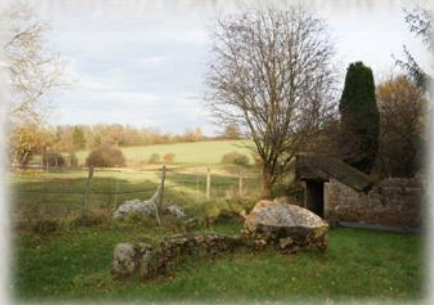
Fontenailles – Photo CCBN ©

L'église de Saint-Ouen-en-Brie structurée en trois parties, chœur rectangulaire, nef et clocher, jouxte un ancien domaine (actuellement exploitation agricole), dont perdure encore une tour du XIIIe siècle.