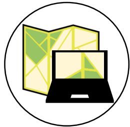
Initiation et perfectionnement à la cartographie 2 jours