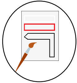
Baliseur 2 jours