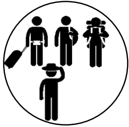
Correspondant Tourisme 1 jour