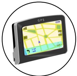
Initiation et utilisation avancée du GPS 2 jours