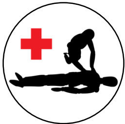
PSC1 1 jour