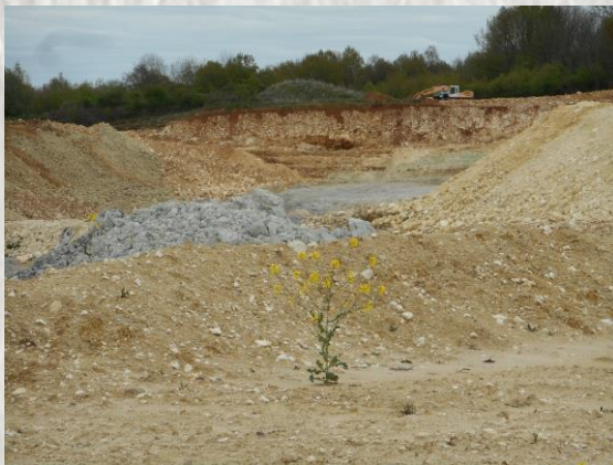
Carrière d'extraction d'argile à ciel ouvert

Fouilles archéologiques de Poigny : Le site de Poigny était occupé dès la fin de l'âge de fer au 1 er siècle avant Jésus Christ, période de l'indépendance gauloise. En 1990, ont été mis à jour, une voie dallée, un habitat gaulois, des mosaïques et tessons de céramique gallo-romains sur un oppidum à 135m. A l'époque mérovingienne, puis carolingienne, un village se fixe sur les hauteurs sous le nom de Poigny comme le prouve un écrit de 1265. Des vestiges de l'Eglise Saint-Michel des 6 e , 13 e et 17 e siècles ont été retrouvés. A la fin du Moyen-Age au 15 e siècle, les habitants s'installèrent en contrebas le long d'une route de la vallée.