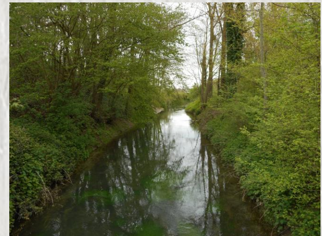
La Voulzie à Septveilles le bas

Du plateau de la Brie, couvert de champs, l'itinéraire vous conduira de part et d'autre de la vallée creusée par la Voulzie. Des moulins puis des industries se sont installés le long de cette rivière, urbanisant la vallée boisée par un chapelet de villages devenus pour certains des villes.