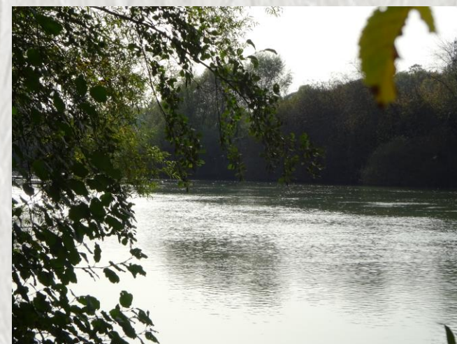
La Marne à Reuil-en-Brie : Photo : CD ©

Montez dans le bois Bréau où, peut-être, aurez-vous la chance de surprendre un chevreuil, puis découvrez un large panorama sur le méandre de Sainte-Aulde. Au passage, ne manquez pas le lavoir du Tillet.