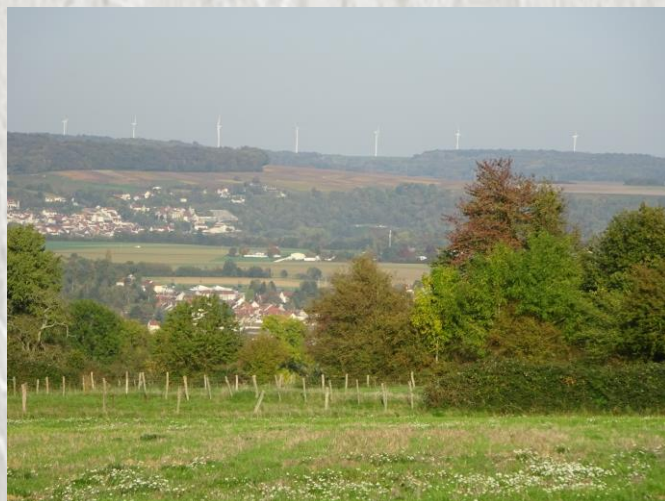
La vallée de la Marne vu du Tillet

Montez dans le bois Bréau où, peut-être, aurez-vous la chance de surprendre un chevreuil, puis découvrez un large panorama sur le méandre de Sainte-Aulde. Au passage, ne manquez pas le lavoir du Tillet.