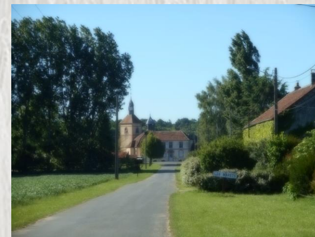
Les Marêts

Au milieu de la campagne, de villages en hameaux, cette randonnée vous fera découvrir : ferme seigneuriale, prieuré, château, églises, au riche passé historique.